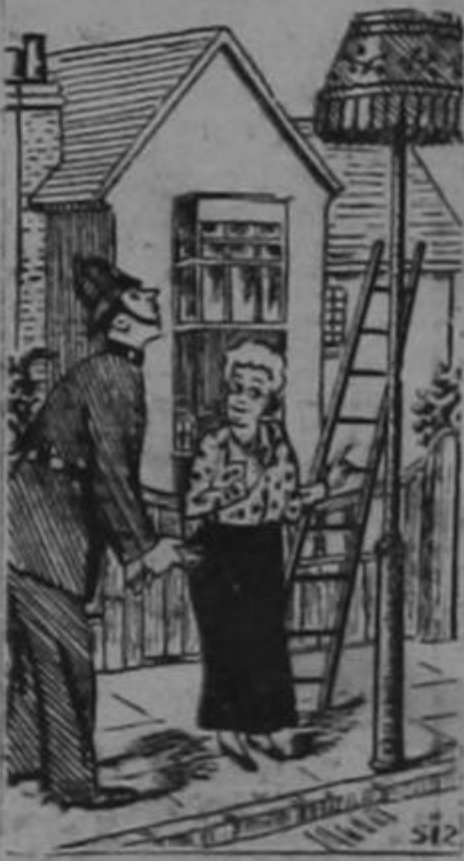
Como la municipalidad me la uso delante de casa, yo he querido hacerla lo más atractiva posible. (Passing Show, Londres)

Día 25: LA ANUNCIACION. Patrona de los radioescuchas que sus males oyen. Es decir, oye sus anuncios, oye; porque hay cada emisora que es una ANUNCIACION.