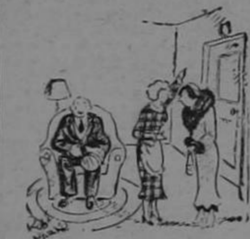
Se rompió el dedo tratando de procurarme ese amuleto de buena fortuna. (Everybody's Londres)