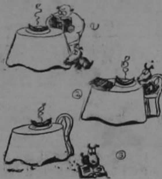
Un perro inteligente.